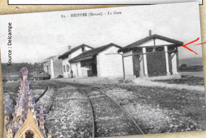
St. - HEIPPES (Meuse). - La Gare