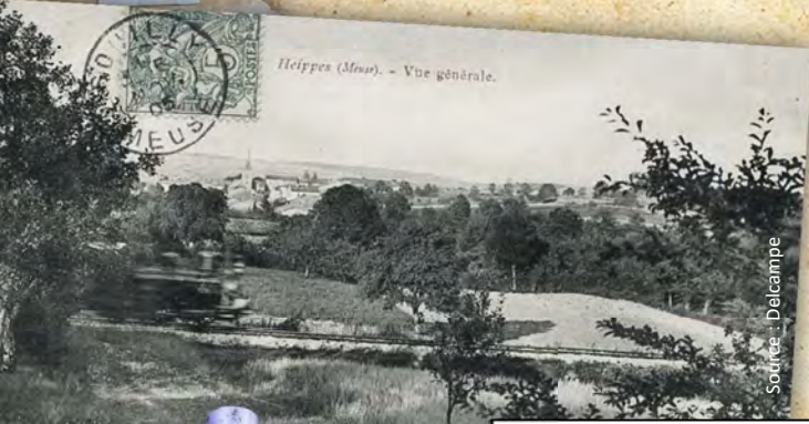
Heippes (Meuse). - Vue générale.