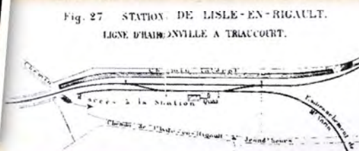
Fig. 27 STATION DE LISLE-EN-RIGAULT. LIGNE D'HAIRONVILLE A TRIAUCOURT.

Au niveau de la gare, on comptait deux embranchements, dit « de Mr Varin », pour desservir la papeterie. Le premier embranchement partait après le quai et se dirigeait vers le sud du site. Il était emprunté par les wagons de charbon pour alimenter les chaudières de l'usine. Un hangar a été construit ensuite sur cette voie.