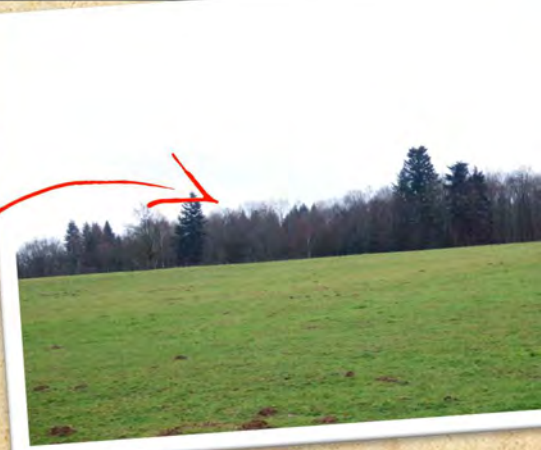
Quinquette hier, seules les vaches y dansent aujourd'hui !