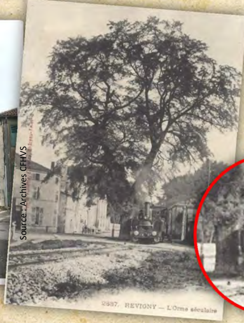
2837. REVIGNY - L'Orme séculaire

A cet endroit se dressait un orme séculaire . Face l'attachement des locaux pour cet arbre vénérable, les constructeurs du Tacot ont modifié le tracé pour contourner l'obstacle, permettant ainsi de le conserver.