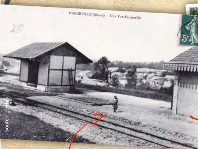
HARGEVILLE (Meuse). - Une Vue d'ensemble