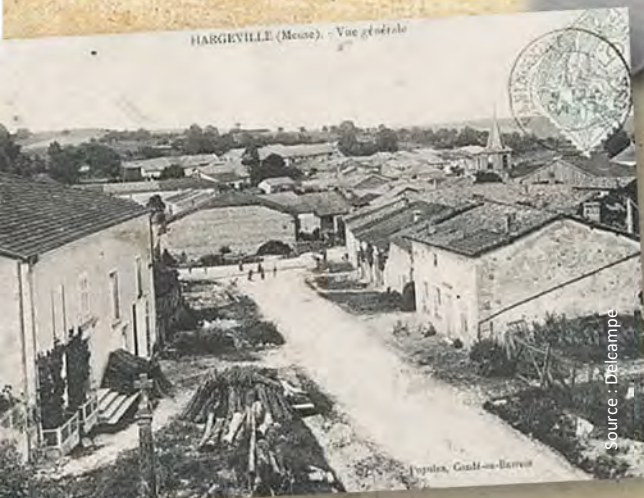
HARGEVILLE (Meuse). - Vue générale

Un jour peut-être, Suzanne et ses wagons passeront à nouveau sur ce pont ... ?